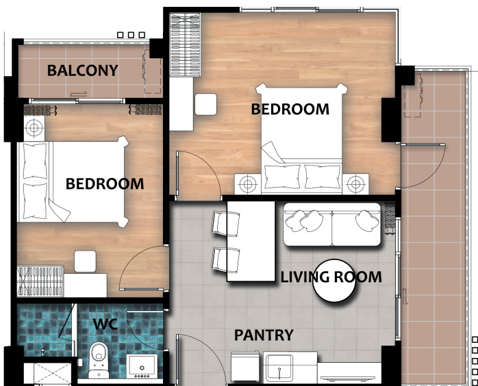
TYPE 2B-A 53.68 Sq.m.

ห้องชุดขนาด 31.06 – 53.68 ตารางเมตร ที่ประกอบไปด้วยแบบ 1 ห้องนอน และ 2 ห้องนอน 1 ห้องครัว, 1 ห้องนั่งเล่นและมุมนั่งรับประทานอาหาร กว้างขึ้นแบ่งเป็นสัดส่วน พร้อมระเบียงยาว ชมวิวดูได้ 360 องศา