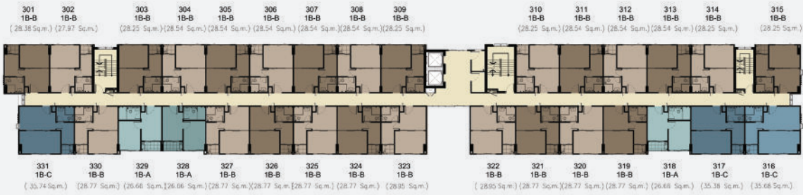
FLOOR PLAN 3 rd -8 th Floor