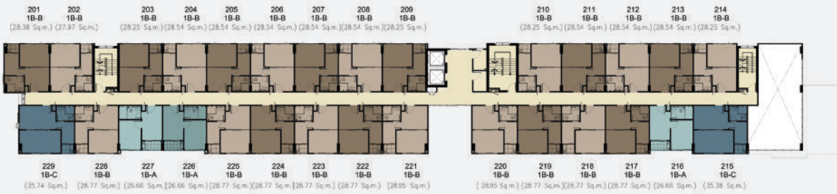
FLOOR PLAN 2 nd Floor