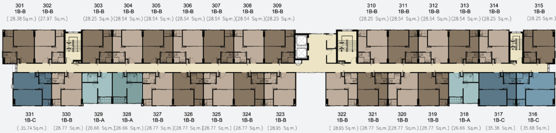
FLOOR PLAN 3rd-8th Floor