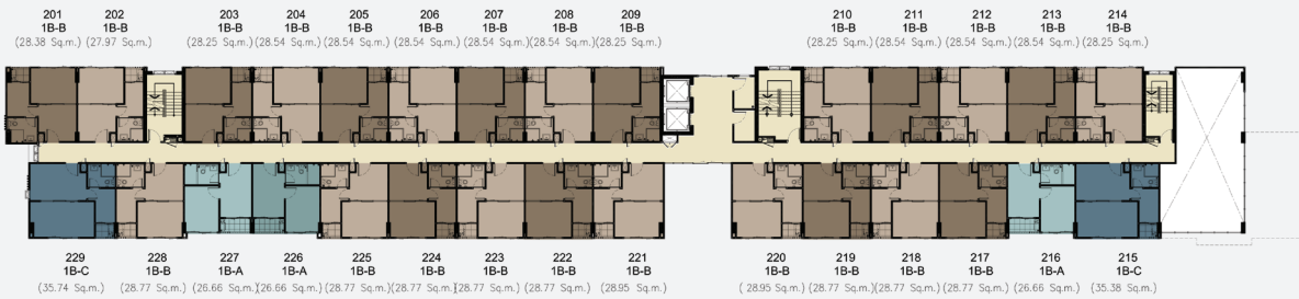
FLOOR PLAN 2nd Floor