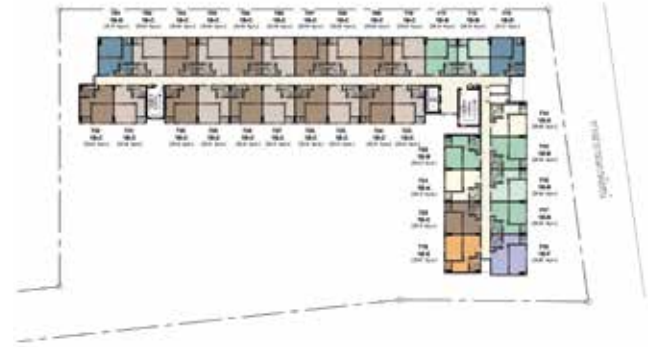
7th FLOOR PLAN